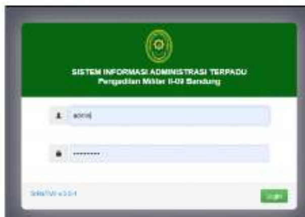
Gambar 3.4 Siratmil Pengadilan Militer II-09 Bandung

Aplikasi Sistem Informasi Administrasi Terpadu Pengadilan Militer II-09 Bandung (Siratmil) yang terinstal di jaringan local dengan alamat : http://192.168.1.225/siratmil yang terdiri dari Administrasi Persuratan, Administrasi Kepaniteraan, Administrasi Kepegawaian, Administrasi Keuangan dan BMN, Administrasi Umum dan Perpustakaan.