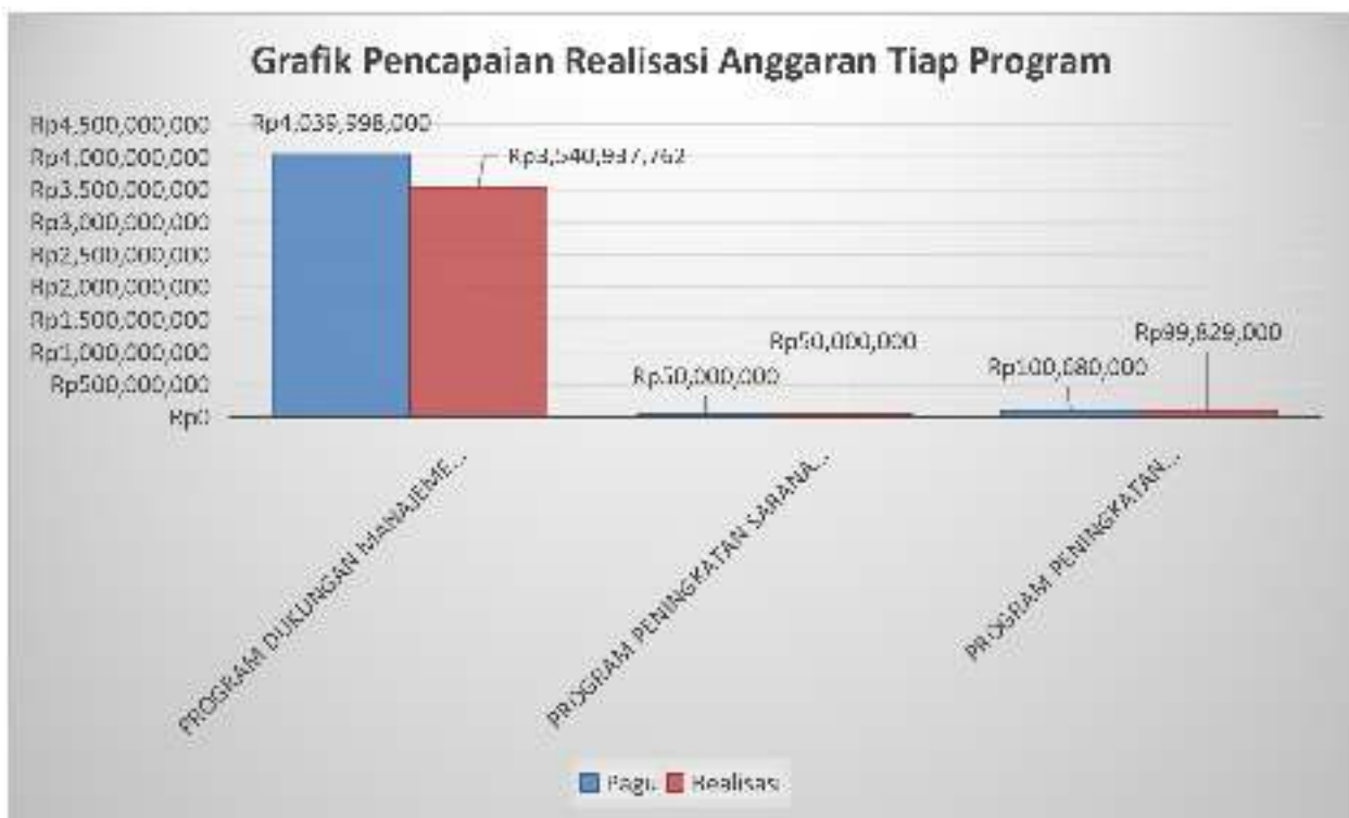
Gambar 3.1 Grafik Pencapaian Realisasi Anggaran Tiap Program

2. DIPA Nomor : SP DIPA-005.05.2.663272/2019 tanggal 5 Desember 2018 (Direktorat Jenderal Badan Peradilan Militer dan TUN).