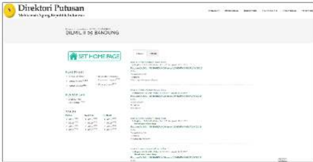
Gambar 3.3 Direktori Putusan