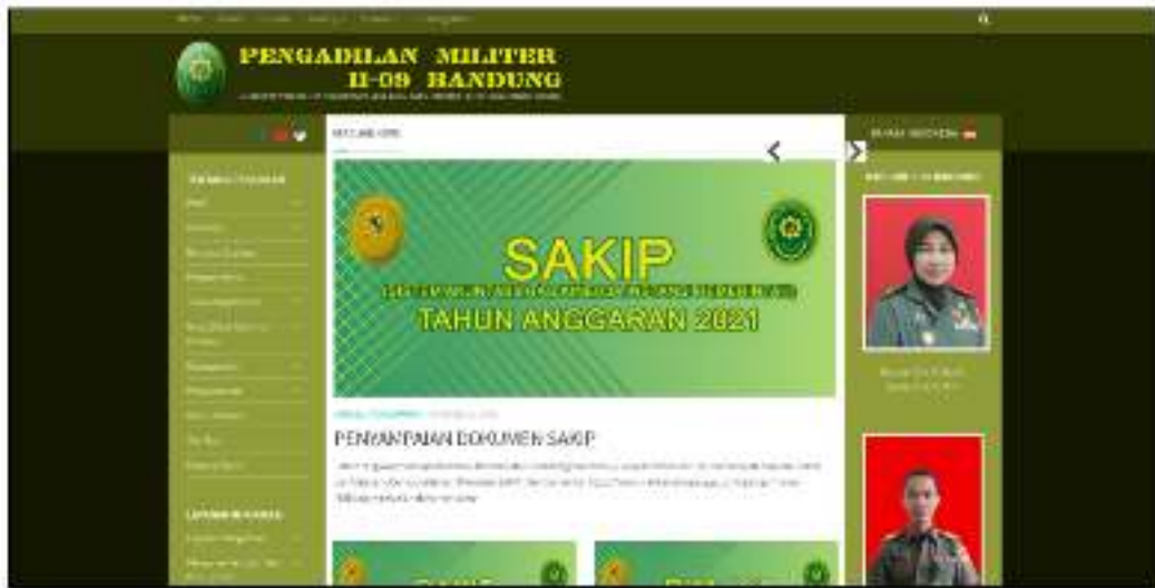
Gambar 3.1 Website Pengadilan Militer II-09 Bandung https://www.dilmil-bandung.go.id/