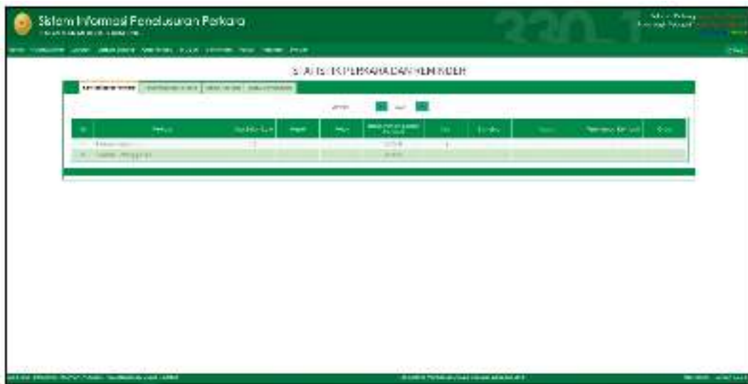
Gambar 3.2 SIPP Lokal http://192.168.1.225/sipp

Saat ini SIPP Pengadilan Militer II-09 Bandung telah memperbaharui versi SIPP terbaru yaitu versi 3.3.0-1 yang telah terintegrasi dengan SIPP Pengadilan Militer Tinggi II Jakarta dan SIPP Mahkamah Agung RI.